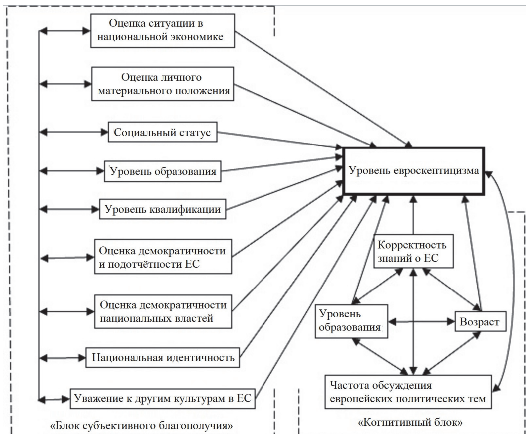
Модель 1 – полный набор факторов 1

Показав наличие взаимосвязей, предсказанных моделью, можно переходить к упомянутой задаче прогнозирования зависимого показателя по известным значениям независимых переменных. Значения, полученные обратным регрессионным анализом, сравнивались с реальными ответами опрошенных.